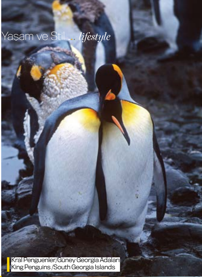
Kral Penguenler/Güney Georgia Adaları King Penguins /South Georgia Islands