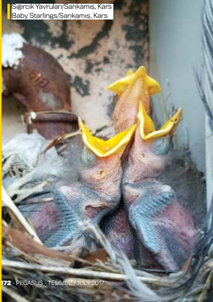
Sıgırcık Yavruları/Sarıkamış, Kars Baby Starlings/Sarıkamış, Kars