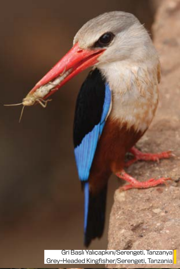
Gri Başlı Yalıcakını/Serengeti, Tanzania Grey-Headed Kingfisher/Serengeti, Tanzania