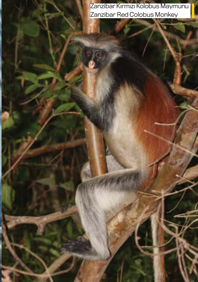
Zanzibar Kırmızı Kolobus Maymunu Zanzibar Red Colobus Monkey