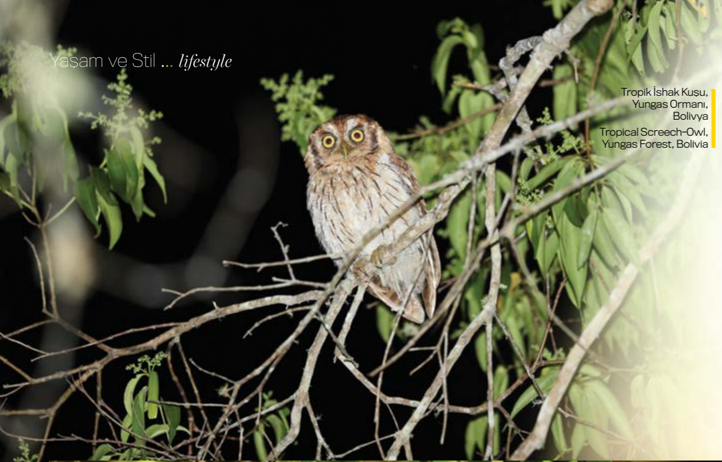
Tropik İshak Kusu, Yungas Ormanı, Bolivya Tropical Screech-Owl, Yungas Forest, Bolivia