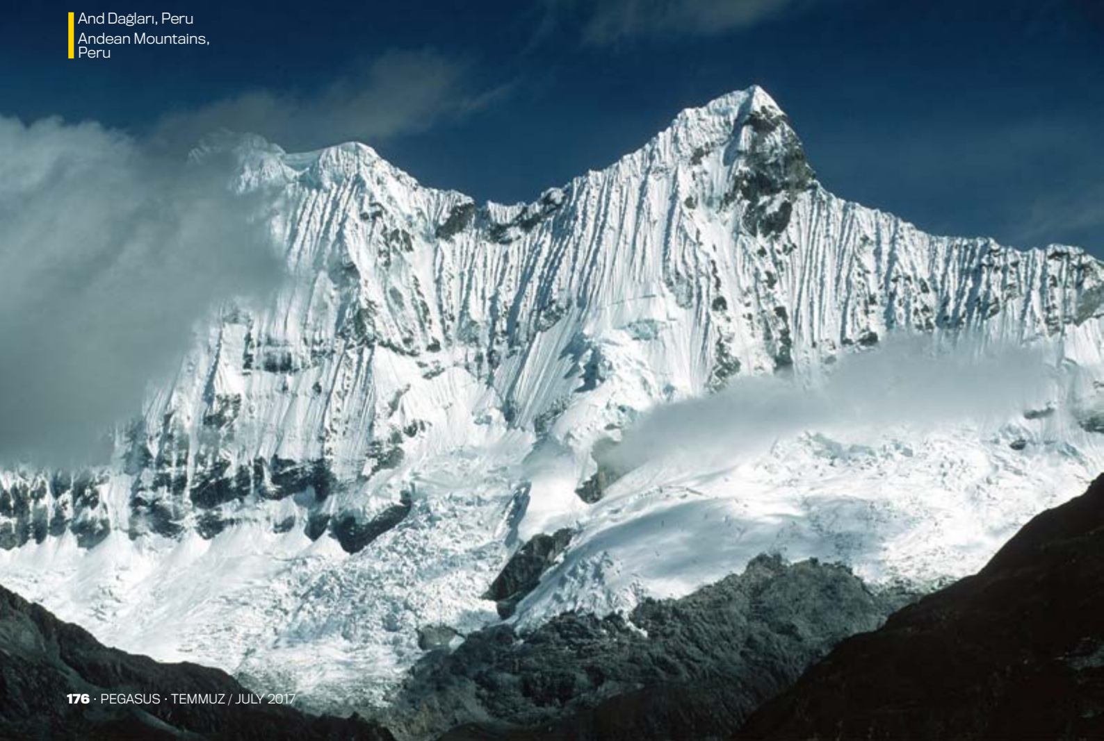
And Dağları, Peru Andean Mountains, Peru