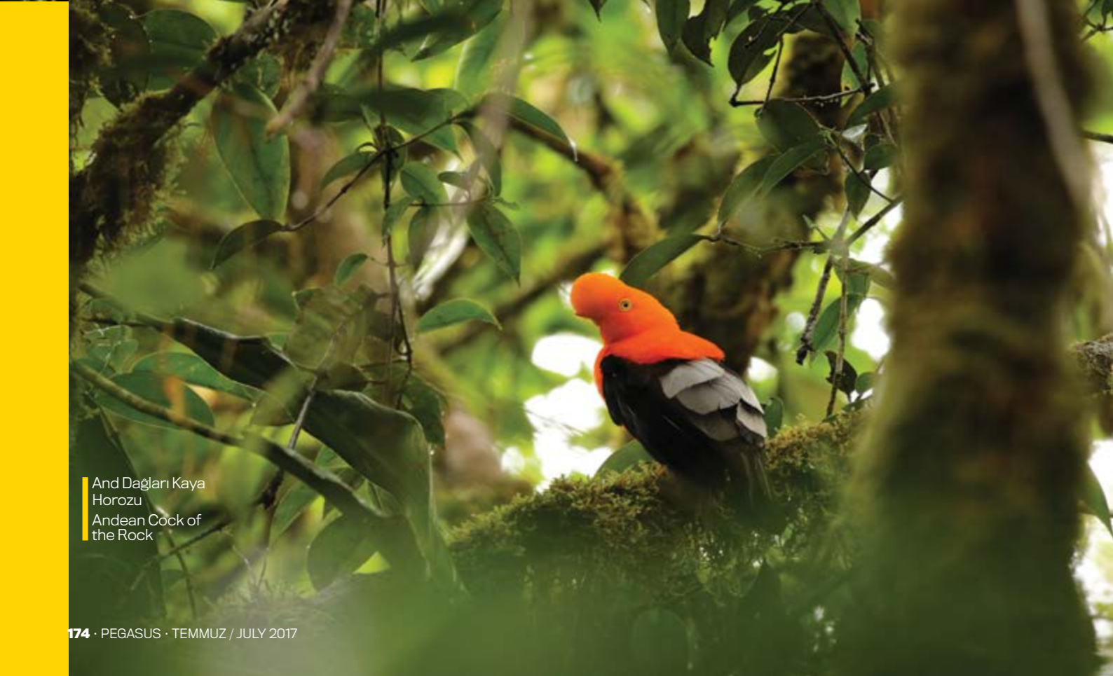
And Dağları Kaya Horozu Andean Cock of the Rock